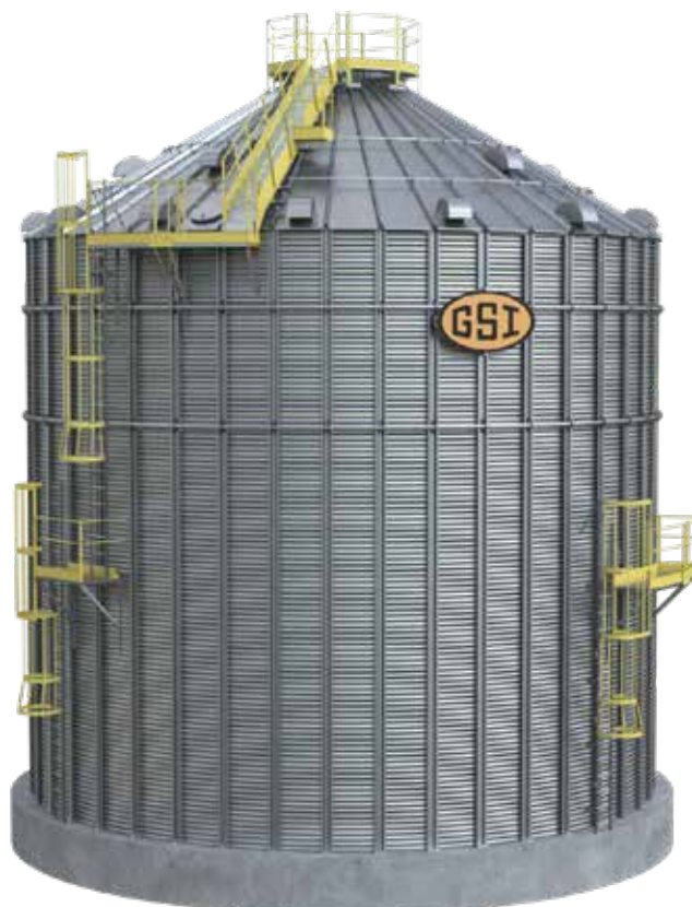
Silo armazenador fundo plano