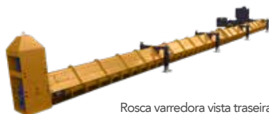
Rosca varredora vista traseira