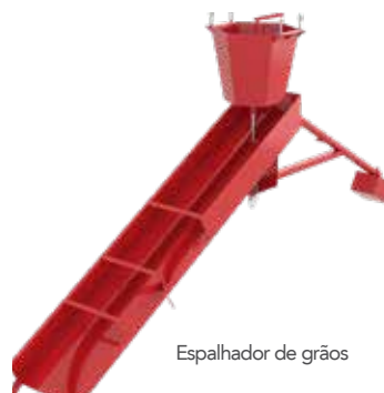
Espalhador de grãos

O espalhador de grãos gravitacional é utilizado para dividir o fluxo em distâncias diferenciadas, criando anéis concêntricos de grãos. Fabricado em aço carbono, possui chapas de polietileno e guias direcionadoras com aço resistente ao desgaste na sua parte central. A rotação do espalhador é provocada pelo fluxo de descarga de grão, o que elimina consumo de energia elétrica, além de possuir passagem para o cabo de termometria no centro do espalhador.