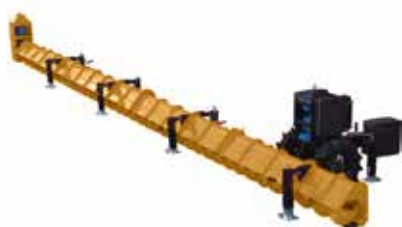
Rosca varredora vista frontal