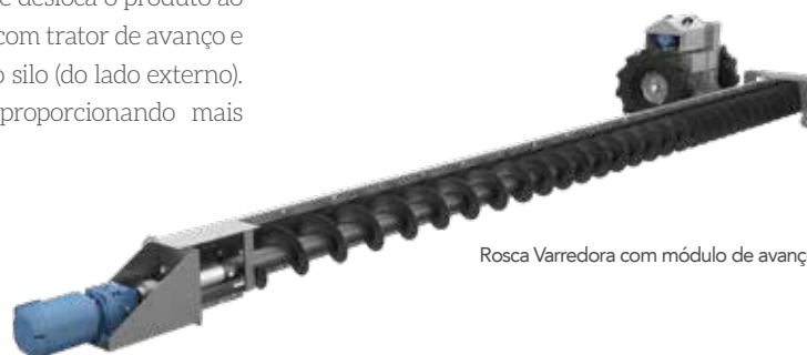
Rosca Varredora com módulo de avanço

A rosca varredora GSI remove os grãos restantes no interior do silo, após a descarga, através de um helicóide que desloca o produto ao registro central. Possui controle manual ou com trator de avanço e comando elétrico fixado próximo a porta do silo (do lado externo). Seu sistema de funcionamento é fácil, proporcionando mais rapidez no processo.